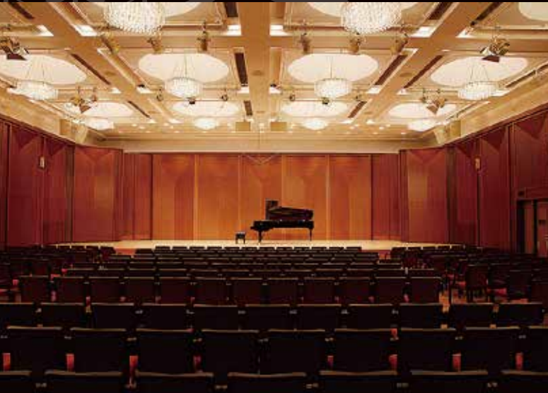
ガラコンサートが開催される サントリーホール プルーローズ