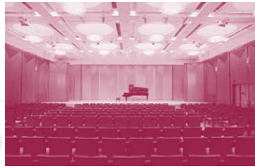
ガラコンサートが開催される サントリーホール ブルーローズ

審査には全国で開催されるすべての地区予選から日本語に堪能な外国人の先生も加わります。また先生方からの細やかな講評を受け取り、直接質問したり、ピアノを使っのミニレッスンを受けたりと、上達に役立つコーナーをいろいろとご用意しております。ピアノを愛する皆様のご参加を心よりお待ちしております。