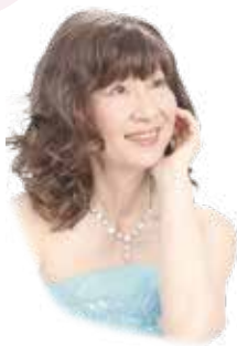
創設者 故・杉谷昭子

ヨーロッパ国際ピアノコンクール(EIPIC)は、主にヨーロッパを舞台に活躍したピアニスト、故杉谷昭子が2010年に創設したもので、おかげさまで今年12年目を迎えることが出来ました。 このコンクールは杉谷昭子のヨーロッパと日本での長い音楽経験を元に、世界中で受入れられるピアノ演奏を次世代に伝える取り組みとなっており、多くの方々が国内で身近にヨーロッパスタイルのピアノコンクールを有意義に体験していただけるものと確信しております。 コンクールでは、単なる「テクニック重視」に偏らず、「音楽性」「音色の美しさと響き」とともに「自由で個性的な表現」も高く評価してまいります。 すべての審査には外国人の先生も加わり、個々の曲ごとに丁寧な講評を致します。 ピアノを愛する皆様のご参加を心よりお待ちしております。