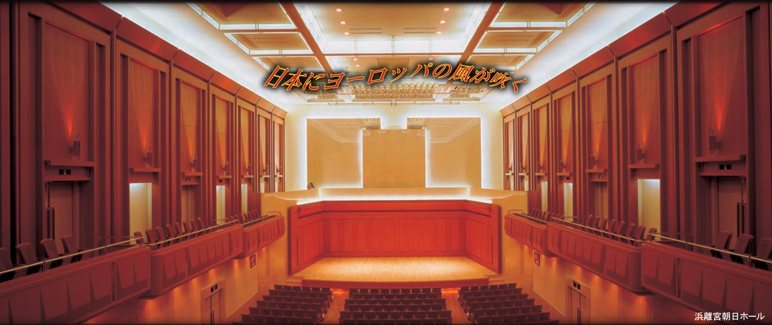
浜離宮朝日ホール