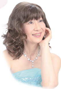
創設者 故・杉谷昭子

ヨーロッパ国際ピアノコンクール (EIPIC)は、主にヨーロッパを舞台に活躍したピアニスト、故・杉谷昭子が2010年に創設したもので、おかげさまで今年16年目を迎えることができました。 このコンクールは杉谷昭子がヨーロッパと日本における長い音楽経験をもとに、世界中で受け入れられるピアノ演奏を次世代に伝える取り組みとなっています。ここでは多くの方々が身近にヨーロッパスタイルのピアノコンクールを有意義に体験していただけるものと確信しております。 このコンクールでは、単なる「テクニック重視」に偏らず、「音楽性」「音色の美しさと響き」とともに「自由で個性的な表現」を高く評価してまいります。 審査には全国で開催されるすべての地区予選から日本語に堪能な外国人の先生も加わります。また先生方からの細やかな講評を受け取り、直接質問したり、ピアノを使っのミニレッスンを受けたりと、上達に役立つコーナーをいろいろとご用意しております。ピアノを愛する皆様のご参加を心よりお待ちしております。